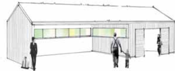
Återbruk 105 m 2