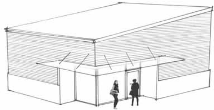
Personalbyggnad 146 m 2