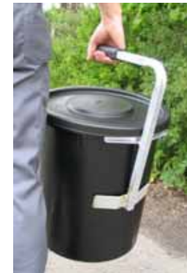
Hjälpmiddel som används