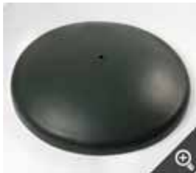
Brunnslock i glasfiber