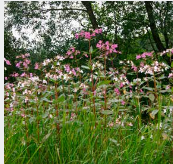
Jättebalsaminen är en av de växter som ska hanteras med stor försiktighet.