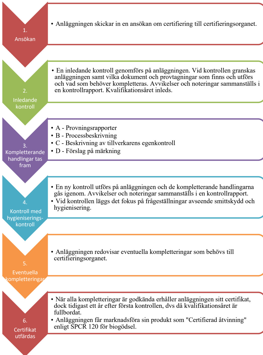
Figur 1. Ansöknings- och kvalifikationsförfarandet.