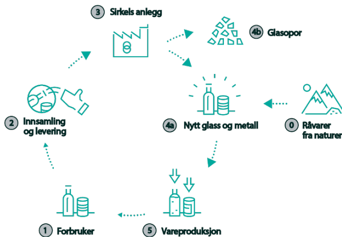
Figur 2. Beskrivning av det norska insamlingssystemet för glas- och metallförpackningar

Även för metallförpackningar är resultaten relativt höga. Den totala återvinningsgraden uppgår till cirka 86 procent, vilket innebär att en stor andel av de insamlade metallförpackningarna återförs till materialkretsloppet och ersätter jungfruliga råvaror i metallproduktionen.